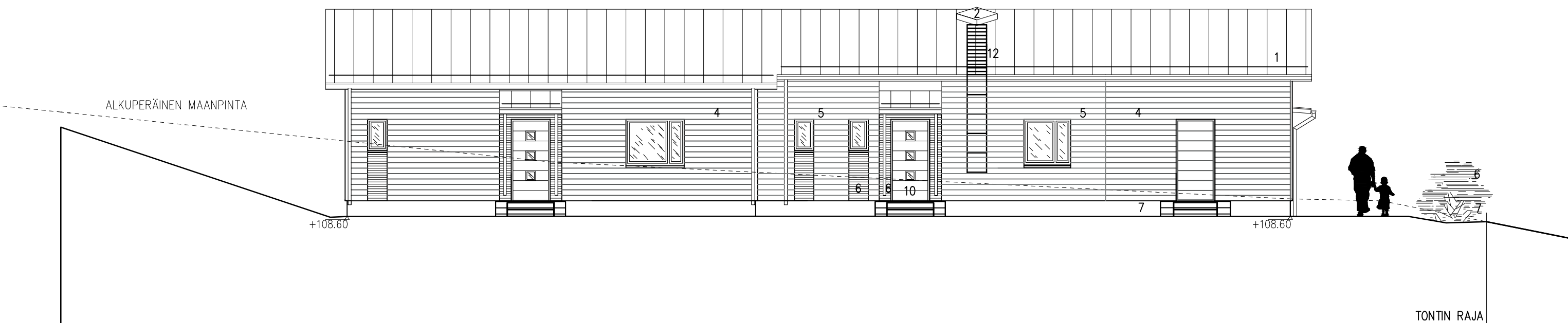
RAKENNUS B JULKISIVU KAAKKOON 1 : 100