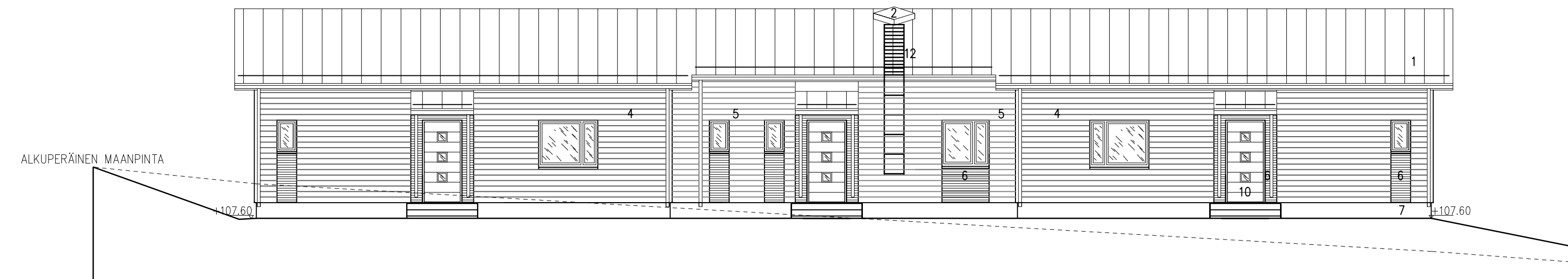
RAKENNUS A JULKISIVU KAAKKOON 1 : 100