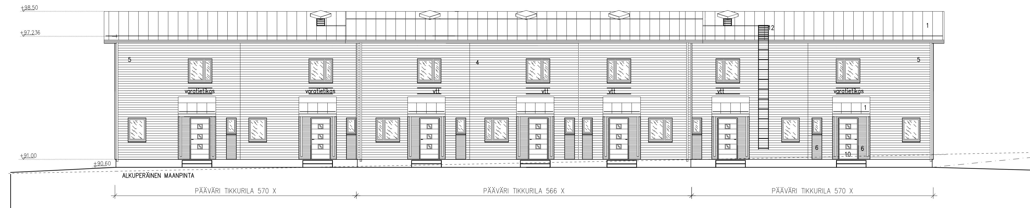
RAKENNUS B JULKISIVU POHJOISEEN 1 : 100