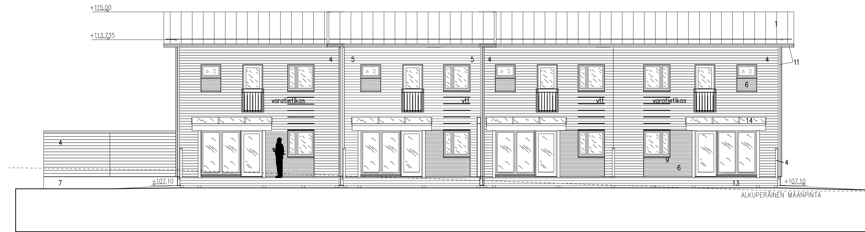
RAKENNUS D JULKISIVU Lounaaseen 1 : 100