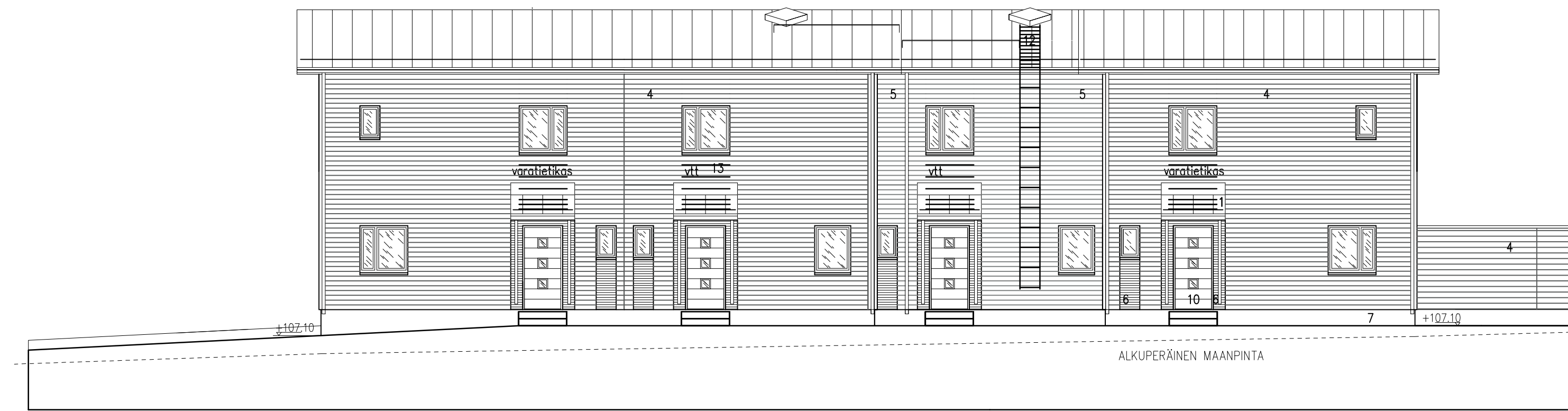
RAKENNUS D JULKISIVU Koilliseen 1 : 100