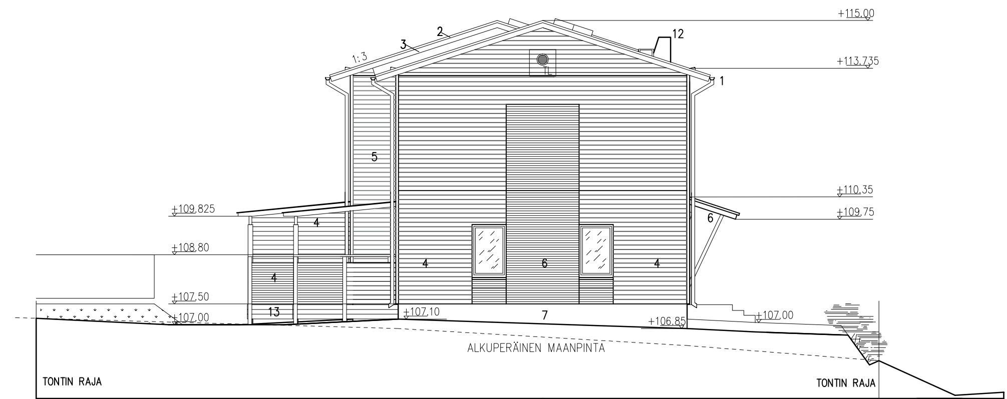
RAKENNUS D JULKISIVU KAAKKOON 1 : 100