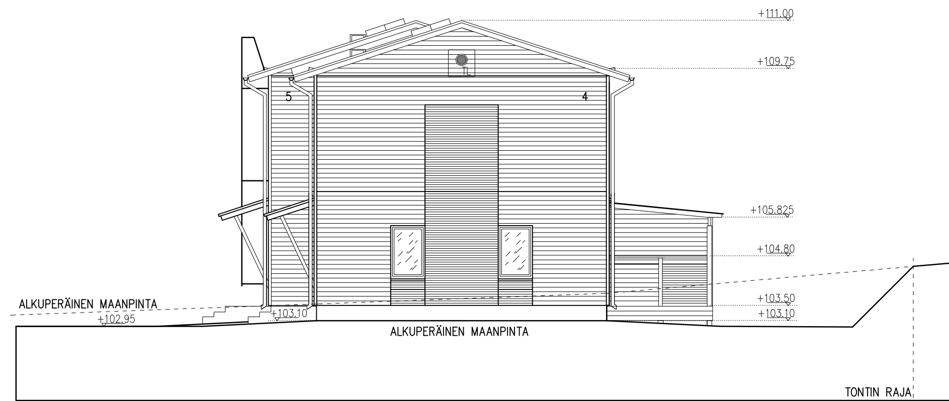
RAKENNUS D JULKISIVU POHJOISEN 1 : 100