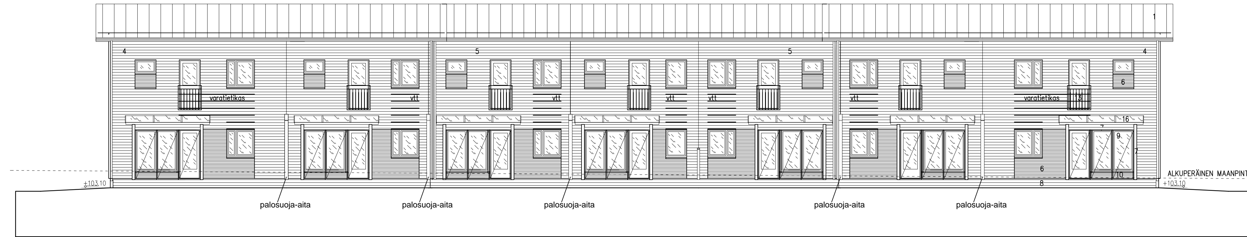
RAKENNUS D JULKISIVU LÄNTEEN 1 : 100