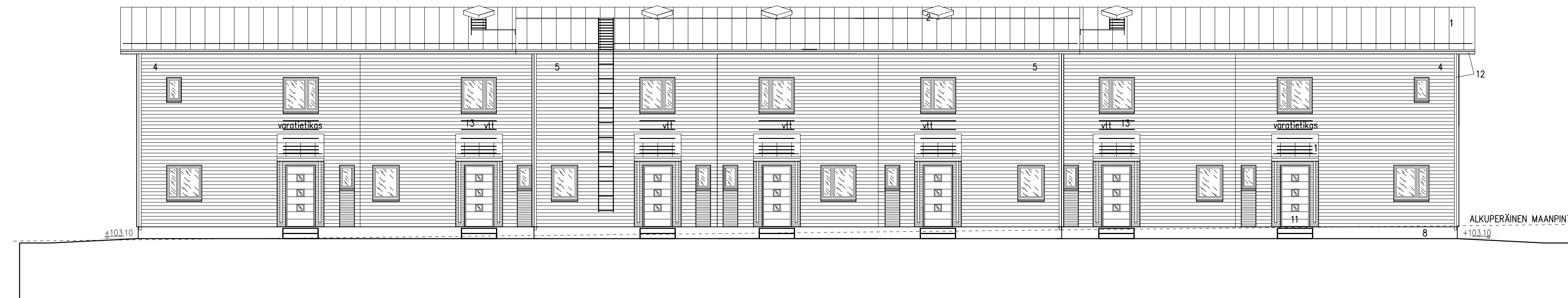
RAKENNUS D JULKISIVU ITÄÄN 1 : 100